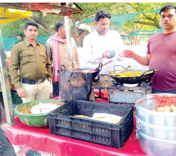
हरिभूमि न्यूज ▶ पलेरा

नगर में गंदगी फैलाने पर नगर परिषद के द्वारा टैले वालों एवं दुकानदारों को कई बार समझाइश दी गई लेकिन इसके बावजूद भी जब सकारात्मक नतीजा नहीं निकला तब नगर परिषद द्वारा नगर के टैले