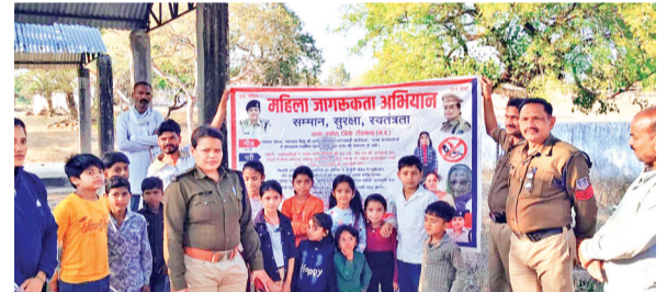
हरिभूमि न्यूज ▶ टीकमगढ़